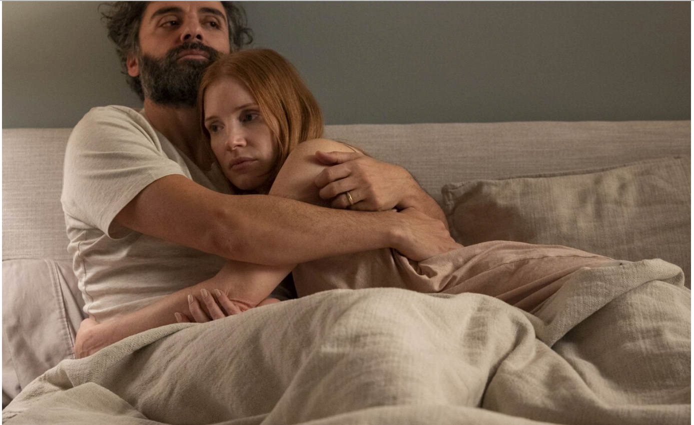
Imagen simbólica de 'Secretos de un matrimonio' (2021) HBO Max